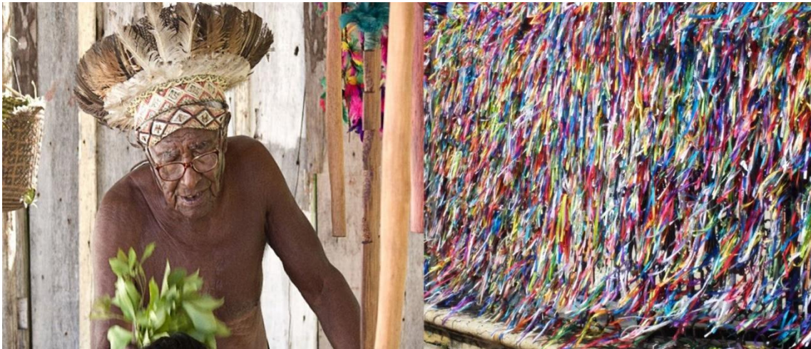
Figura 5 - Michele Angelillo. Série Brazil. Il mio Brasile

A visão de Angelillo mescla paisagens, aspectos sociais relevantes, pontos turísticos, a alegria tropical a uma visão particular de um flâneur , que ao exercer “a botânica no asfalto”, como bem afirmou Benjamin, acaba por deslindar a “poesia concreta de cada esquina”, sob um olhar que não é só de êxtase ou de admiração, mas que, acima de tudo, produz uma reflexão.