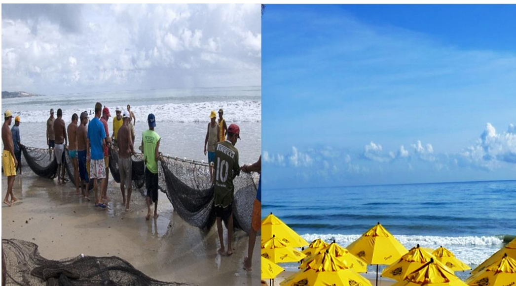
Figura 4 - Michele Angelillo. Série Brazil. Il mio Brasile